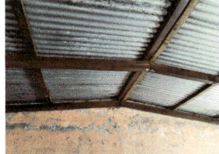
Foto 2: Sustrucción de soporte de madera en mal estado por metal.