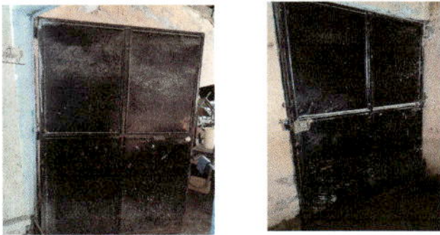
Foto 3: Sustrucción de Puertas en mal estado por oxidación en la base y no tiene chapas.