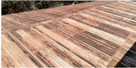
Foto 1: Sustrucción de lámina por oxidación y filtración de agua en tiempos de lluvia.