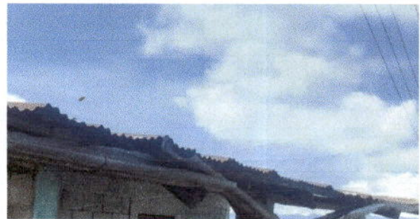
Foto 6: Sustrucción de Bajadas de agua Pluvial de metal por tubo PVC 3" en mal estado.

Observación: Si es necesario se pueden agregar hojas adicionales y actualizar el número de hojas.